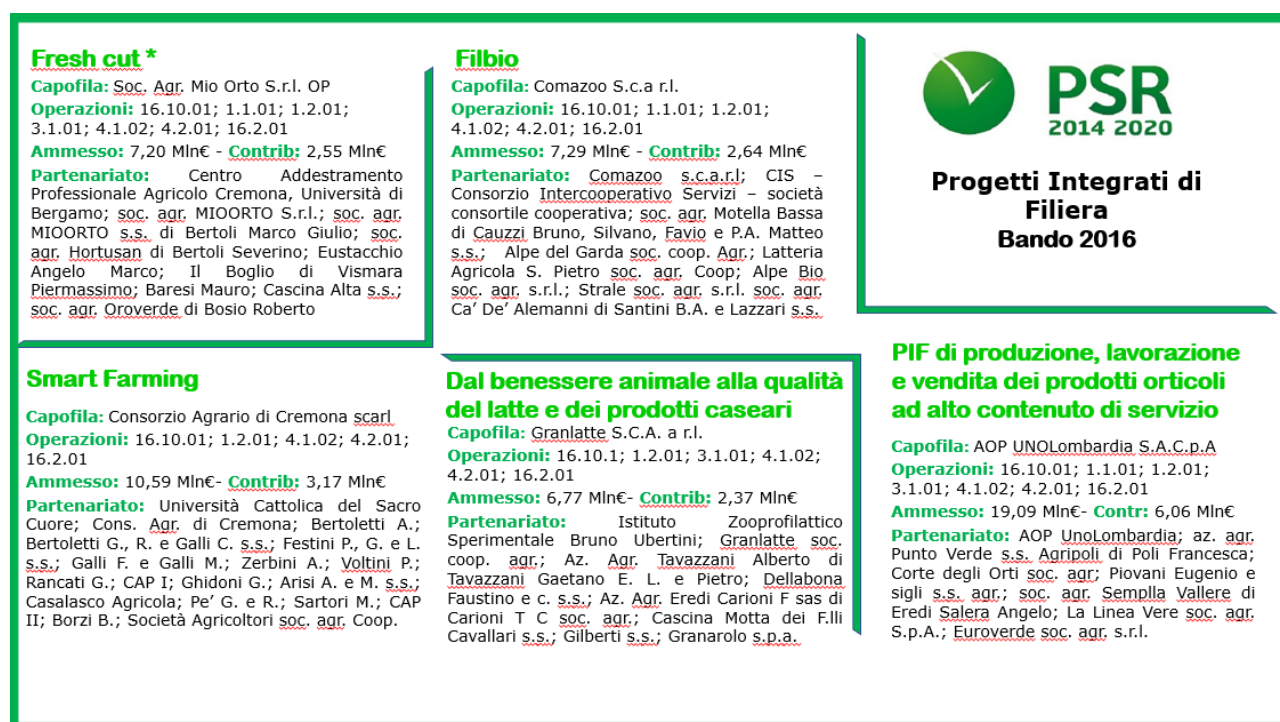
Figura 3. I PIF e le partnership relative al primo bando.

(*) Per quanto riguarda il progetto Fresh cut si segnala che sono stati riportati gli importi del decreto n. 13598 corretti rispetto ad un errore materiale riguardante l'operazione 3.1.01.